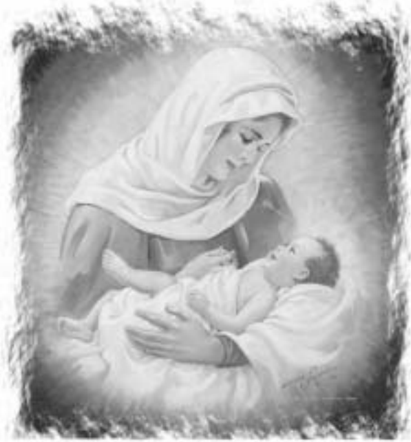
Ai ôi lai trong Thay và Thay ôi lai trong ngöôi aý, thì ngöôi aý sinh nhiều hoa trái. Gioan, 15:4-5

Möng laã Giäng Sinh cöu ý nghĩa nhất laø haý noi göông Me: xin Chúa Thành Thành ñeán tran gặp tâm hồn ta nhö Ngöôi ña ñeán trong long Ñöic Me giúp ta Cảm Nghiệm sâu xa ñöïc tình yêu của Thiên Chúa.